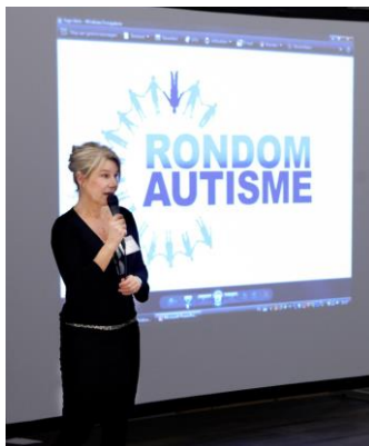
Voorlichting over en rondomautisme

RA werkt met ervaringsdeskundigen en heeft als doelstelling het verbeteren van kwaliteit van leven en het werken aan een gezond evenwicht voor mensen met autisme, hun mantelzorgers in de directe omgeving zoals ouders, partners en kinderen en verder iedereen die professioneel of privé in aanraking komt met autisme.